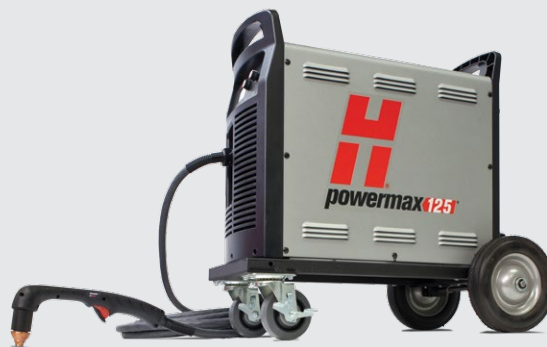
Sada na kolech