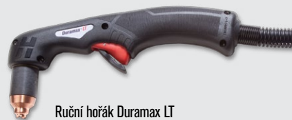
Ruční hořák Duramax LT