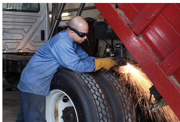
Opravy a úpravy vozidel